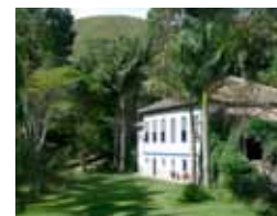
PICINGUABA & CATUÇABA