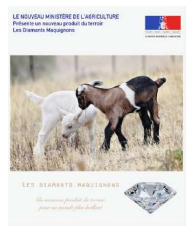
LE NOUVEAU MINISTÈRE DE L'AGRICULTURE, LES DIAMANTS MAQUIGNONS, 2016 © SUZANNE HUSKY ET STÉPHANIE SAGOT

COAL, CONÇOIT ET ORGANISE DES EXPOSITIONS D'ART CONTEMPORAIN ET DES ÉVÉNEMENTS CULTURELS SUR LES ENJEUX DU DÉVELOPPEMENT DURABLE (UNESCO, LA VILLETTE, LA GAITÉ LYRIQUE, FIAC, DOMAINE DE CHAMARANDE (DIRECTION ARTISTIQUE DE 2011-2015), MNHN, MUSÉE DE LA CHASSE ET DE LA NATURE, BERGES DE SEINE, CEEAC...), REMET CHAQUE ANNÉE LE PRIX COAL ART ET ENVIRONNEMENT, SOUTIEN LES ARTISTES PAR L'ACCOMPAGNEMENT ARTISTIQUE ET L'AIDE À LA PRODUCTION ET CONTRIBUE À LA TRANSFORMATION DES TERRITOIRES AVEC SON LABORATOIRE DE LA CULTURE DURABLE. CES RAPPROCHEMENTS ENTRE CULTURE ET DÉVELOPPEMENT DURABLE FONT AUJOURD'HUI L'OBJET D'UNE VÉRITABLE DYNAMIQUE INTERNATIONALE À LAQUELLE COAL PARTICIPE EN TANT QUE PREMIER ACTEUR FRANÇAIS. À CE TITRE, COAL A MIS EN OEUVRE EN 2015, ARTCOP21, L'AGENDA CULTUREL DE LA COP21.