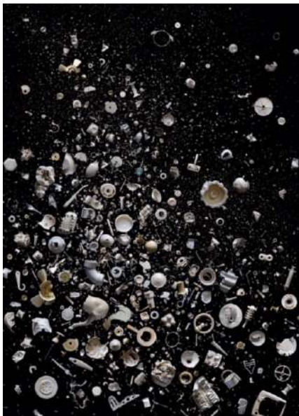
MANDY BARKER, EVERY... SNOWFLAKE IS DIFFERENT, 2011

Autour du thème « Pure Waste », l'exposition d'Art contemporain de la 5 ème édition de la Biennale 1.618 réunira les œuvres d'artistes internationaux – sélectionnées par notre Commissaire Coal – qui, avec poésie, humour ou ironie, réinventent les déchets en revalorisant la beauté rare de la matière, pour interpeller les visiteurs sur les problématiques d'aujourd'hui, mais surtout les défis de demain.